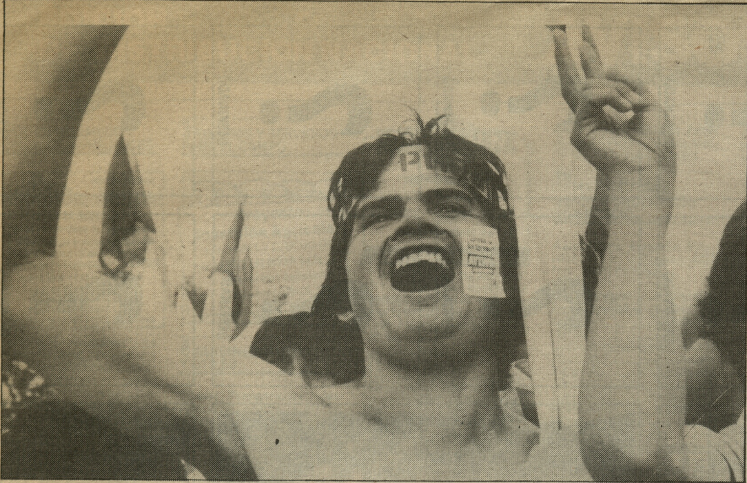
A la hora de celebrar, la alegría fue expresada de variadas formas.