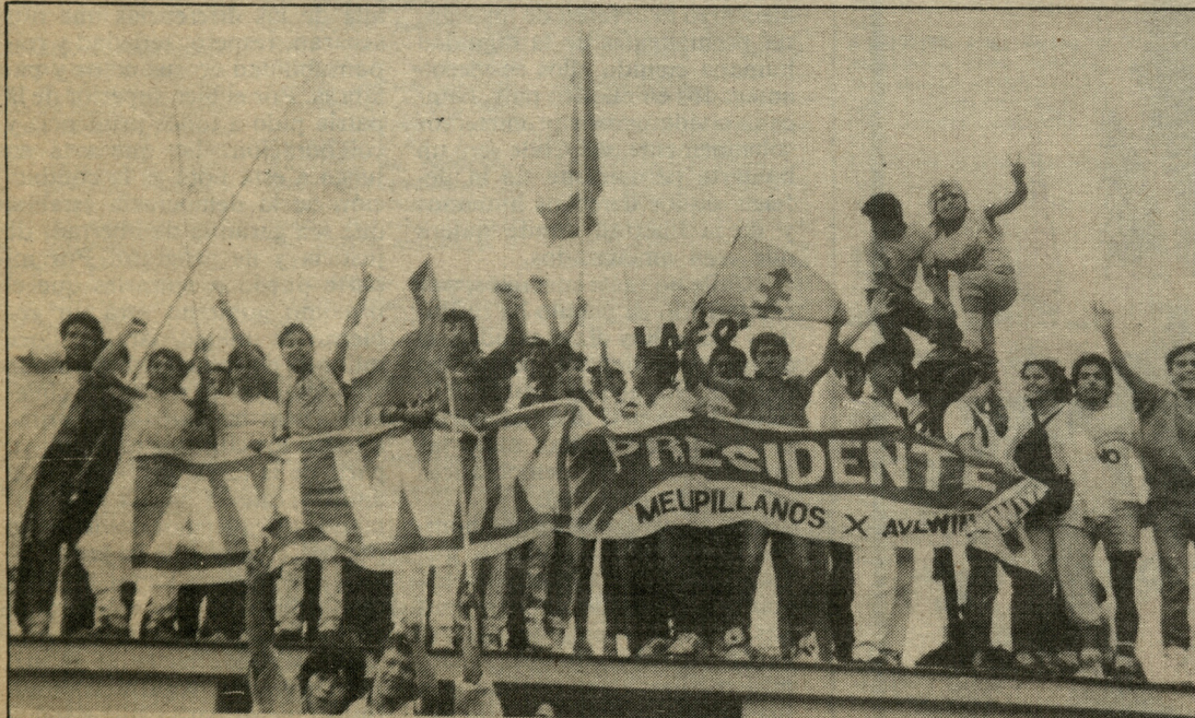
El público asistente estuvo constituido principalmente por jóvenes.

"Me esforzaré lealmente por hacer del poder político un instrumento para unir y no para dividir, para crear y no para destruir, para cerrar viejas heridas que aún duelen en el alma nacional, para abrir caminos a la verdad y a la justicia a fin de lograr la verdadera reconcilia- (Continúa en la página 10).