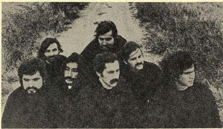
Quilapayan synger fra eksilet.

Blandt deltagerne var repræsentanter for Folkeenhedens partiets ungdomsforbund, de progressive studenter, MIR og mange andre. Den chilenske nationalsang og Internationale blev sunget flere gange, mens deltagerne løftede den knyttede næve. Tusinder af røde nelliker blev kastet fra alle sider, indtil Nerudas grav var fuldstændigt dækket af dem.