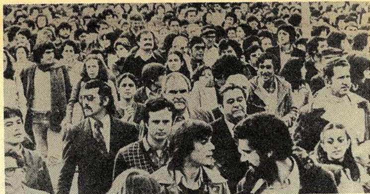
Chilenske arbejdere demonstrerer 1. maj 1979, trods juntaens forbud.

Under strejken kan arbejdsgiverne ansætte den arbejdskraft de anser for nødvendig eller de kan gøre brug af den nye ret, loven sikrer dem, nem-