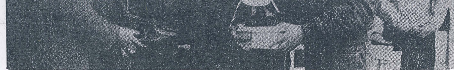
Seguel y Díaz se opusieron al proyecto.